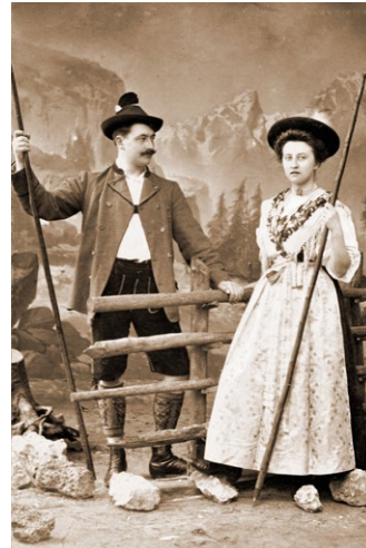
Das Brautpaar schlüpft auf der ersten Station der Hochzeitsreise in Berchtesgaden in die Landestracht. Gleichberechtigt halten sie den Hirten- oder den Wanderstab, um Gipfel zu erklimmen, während sich ihre Hände auf dem Zaun zaghaft berühren. (Weitere Bilder von der Reise finden sich ab S. 134.)