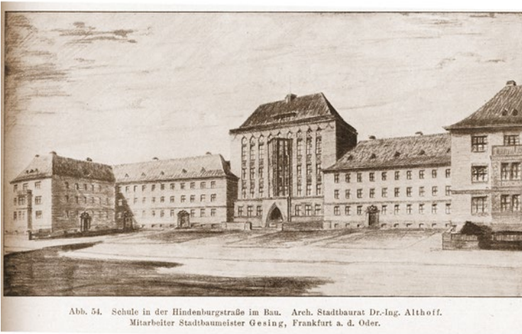
Abb. 54. Schule in der Hindenburgstraße im Bau. Arch. Stadtbaurat Dr.-Ing. Althoff. Mitarbeiter Stadtbaumeister Gesing, Frankfurt a. d. Oder.

Bauzeichnung der Hindenburgschule.